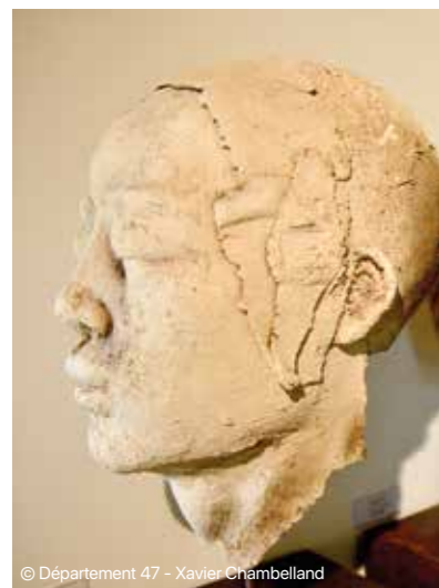
© Département 47 - Xavier Chambelland